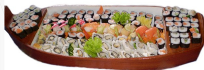
BARCA DE SUSHI 100 cortes