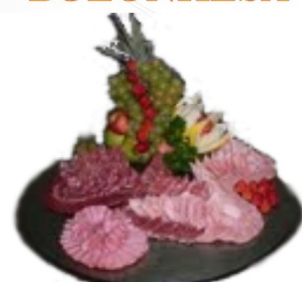
ESPELHO DE FRIO