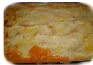
LAZANHA A BOLONHESA