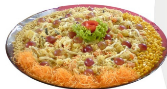
SALPICÃO DE FRUTAS