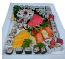
COMBINADO DE SUSHI