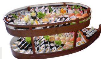
BARCA DE SUSHI 200 cortes