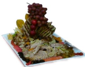
PERNIL DECORADO CALIFORNIA