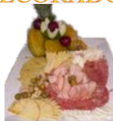
TÁBUA DE FRIOS